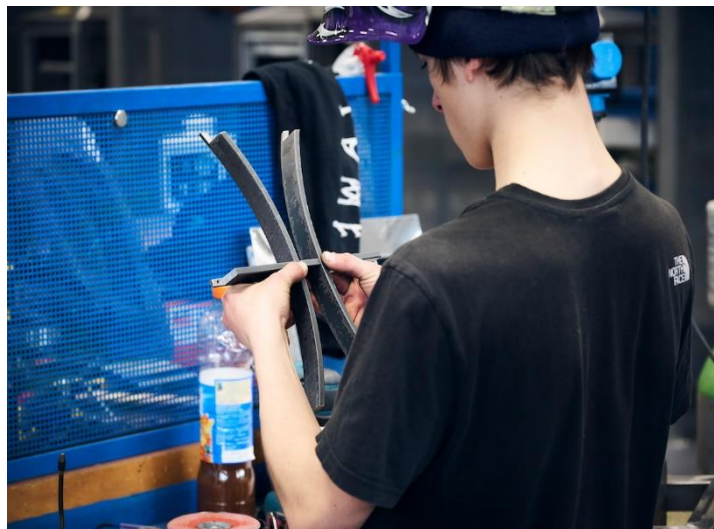
Apprenti en formation au CFCMBG-CM