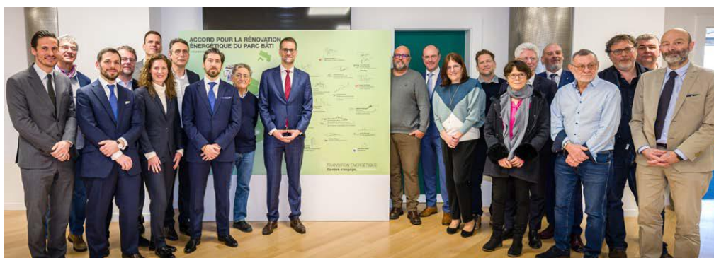
Les signataires de l'Accord pour la rénovation énergétique du parc bâti

Le 21 septembre 2023, le Grand Conseil adoptait la loi 12593 modifiant la loi sur l'énergie (LEn) (Pour réaliser rapidement la transition énergétique des bâtiments conformément au droit fédéral). En substance, elle prévoyait, d'une part, de substituer à l'indice de dépense de chaleur (IDC) le Certificat énergétique cantonal des bâtiments (CECB) comme outil de pilotage de la transition énergétique du parc bâti et, d'autre part, de repousser les délais de rénovation énergétique des bâtiments.