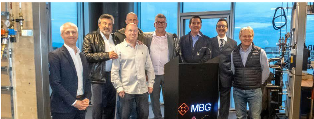
Les membres du groupe de pilotage lors de l'inauguration du CFCMBG le 23 mars 2023

Considérant la complémentarité croissante de nos métiers, notamment dans le contexte des évolutions techniques toujours en marche, avec les autres associations professionnelles de la technique du bâtiment, nous avons œuvré à la réalisation d'un nouveau centre, le Centre de formation commun, le CFCMBG. Il est désormais sur pieds.