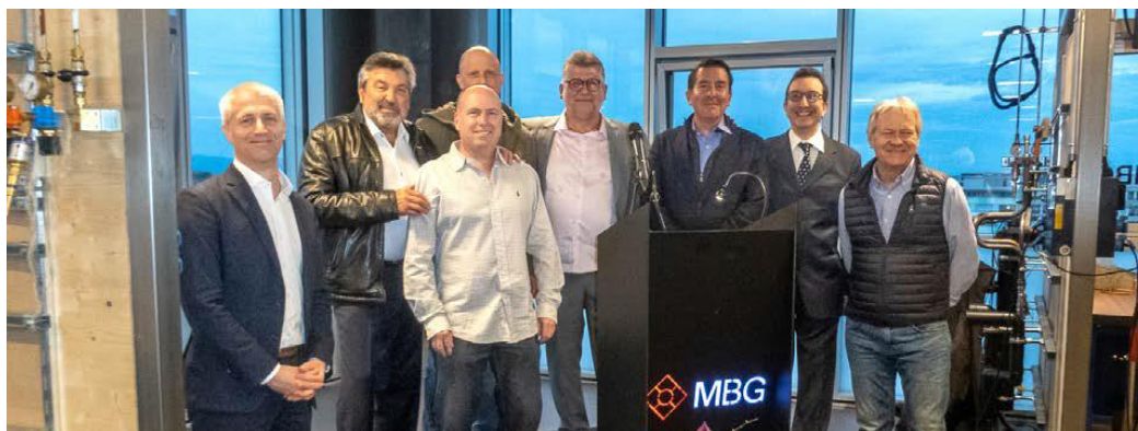
Les membres du groupe de pilotage lors de l'inauguration du CFCMBG le 23.03.2023

Considérant la complémentarité croissante de nos métiers, notamment dans le contexte des évolutions techniques qu'implique la transition énergétique, avec les autres associations professionnelles de la technique du bâtiment, nous avons œuvré à la réalisation d'un nouveau centre, le Centre de formation commun, le CFCMBG. C'est désormais chose faite.