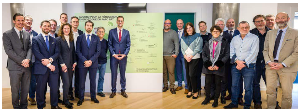
Les signataires de l'Accord pour la rénovation énergétique du parc bâti

Le 21 septembre 2023, le Grand Conseil adoptait la loi 12593 modifiant la loi sur l'énergie (LEn) (Pour réaliser rapidement la transition énergétique des bâtiments conformément au droit fédéral). En substance, elle prévoyait, d'une part, de substituer à l'indice de dépense de chaleur (IDC) le Certificat énergétique cantonal des bâtiments (CECB) comme outil de pilotage de la transition énergétique du parc bâti et, d'autre part, de repousser les délais de rénovation énergétique des bâtiments.