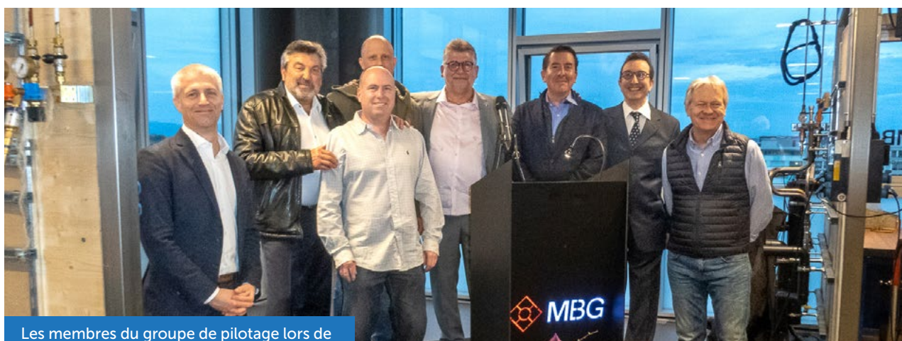
Les membres du groupe de pilotage lors de l'inauguration du CFCMBG le 23.03.2023