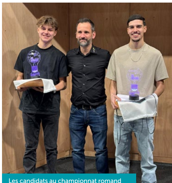
Les candidats au championnat romand des installateurs électriciens et leur coach