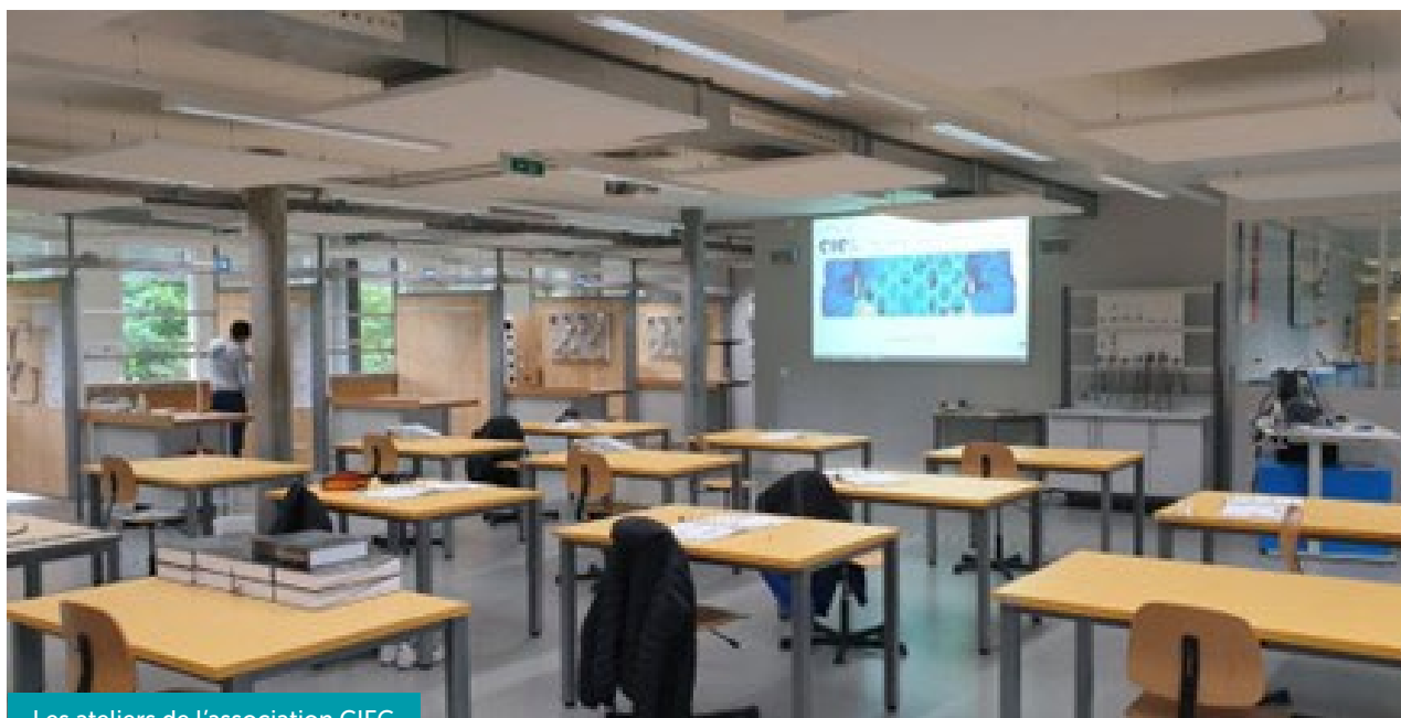
Les ateliers de l'association CIEG

NüKL: il s'agit d'un projet consistant en l'élaboration d'un matériel didactique national pour les cours inter-entreprises (CIE). À l'instar de l'essentiel des sections, EIT.genève a décidé d'y participer, en s'assurant que le résultat serait compatible avec le système des séries parallèles, exception genevoise, consistant en un tronc commun de 2 ans à l'issue duquel les apprentis peuvent, sous condition de résultats, choisir entre le CFC ELMO (3 ans) et le CFC IEL (4 ans).