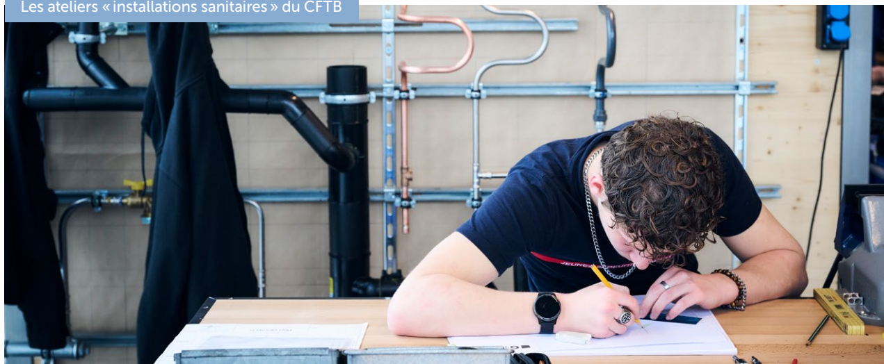
Les ateliers « installations sanitaires » du CFTB

Pour davantage d'informations sur les formations continues que nous proposons, rendez-vous sur la page dédiée du site internet du groupement MBG.