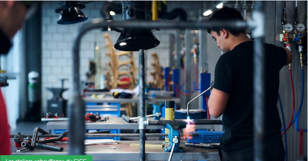
Les ateliers «chauffage» du CICG