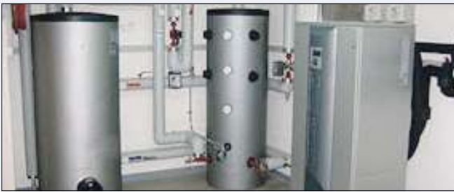
Pompe à chaleur/chauffage.